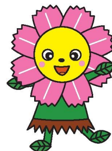
ハッピーコスモスちゃん

市民のみなさんと一緒に、サロンなどの集いの場や地域に必要な助け合い活動を進める専門職です。気軽にご相談下さい。